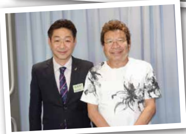
ばんば ひろふみさんの番組にも出演！