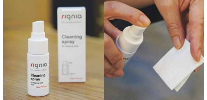
シグニア クリーニング スプレー 990円(税込)