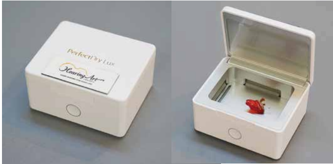
オーティコン パーフェクト ドライラックス (電動乾燥器) 9,878円(税込)

補聴器が汗や湿気を含んでくると、耐久性に影響が でるだけでなく音量・明瞭性の低下が出てきます。 毎日きっちりと乾燥させることをお勧めします。