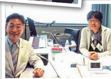
原田 伸郎さんの番組に出演！

最近では、お店への補聴器のお問い合わせも増え、ラジオの活動により、多くの方々が、難聴や補聴器のことを考えるきっかけになったのではないかと思います。今では、お電話口でお話した時に「ラジオと同じ声ですね」とお会いする前から身近に感じていただいている方もいらっしゃいます。これからもより多くの方に、難聴や補聴器のことを知ってもらうための活動を続けることは、私の使命だと思っています。そして難聴でお困りの方が積極的な人生が送れるようになることを心より願っております。