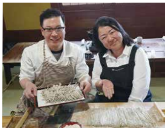
麺の太さが不揃いなのも ご愛嬌♪