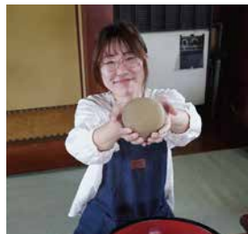
これから麺棒で 伸ばしま〜す！