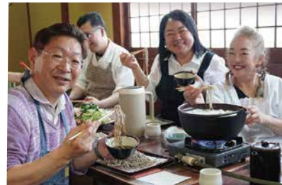
みんなで打ったそばの味は 格別でした！