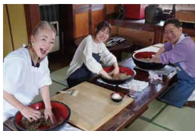
根気のいる作業も みんなでやると楽しい！

店をしていてうれしいのは、「おいしい」というお客様の笑顔を見られることです。ここは住宅地が近いので、地域のお客様が親子2代で訪れてくださることもあるんですよ。これからも、お客様はもちろん従業員にとっても「自分の家」のようにくつろげる店として、長く親しんでいただけるそば屋でありたいと思います。